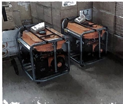
Auch die vor einem Jahr gelieferten Generatoren waren diesen Winter hochwillkommen.

Dank der lange Zeit vielen Einzelspenden, Beiträge von Stiftungen und einer stattlichen Summe des Kantons aus dem Lotteriefonds konnte der Verein sechs grössere Projekte von Partnerorganisationen unterstützen, darunter auch den Bau von vier Modilhäusern in der