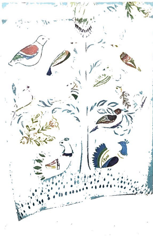
Hans Oppligers «Humanitäre Nothilfe Ukraine» wäre weiterhin gefragt: Den Frieden, den die Tauben auf dem von einem ukrainischen Flüchtlingskind gemalten Bild symbolisieren, wird es wohl nicht so schnell geben.

Mit befreundeten Leuten aus seinem Umfeld gründete Oppliger den Verein Humanitäre Nothilfe Ukraine, was auch die Einrichtung eines Spendenkontos ermöglichte. Innert weniger Wochen wurden über 100 000 Franken auf dieses überwiesen. Unterm Strich gingen seitdem über eine halbe Mil-