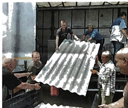
Für ein provisorisches Dach über dem Kopf: Letzten Herbst wurde Wellblech in die Ukraine geliefert.